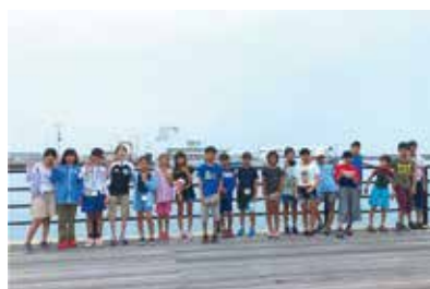
f 子ども支援ネットワーク With Wind

子どもが自分たちで考え、行動する「子どもフリー Day」を実施。子どもに優しいまちの一端を担います。