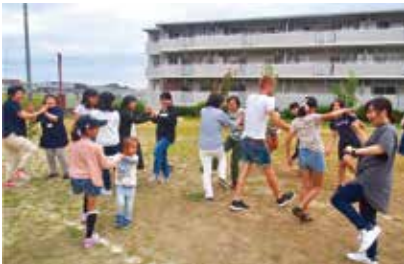
f 子ども寺子屋カフェ

毎月第3日曜に学習支援、ワークショップと夕食提供を行い、南郷地区の世代間交流や子どもの居場所づくりに貢献します。