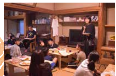
f 古民家 たらいま

様々な角度から映画を体験するイベント。地域に住む若者の赤間宿への関心を高め、活性化に繋がります。