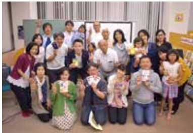
f MBBC 宗像ビブリオバトル倶楽部

本を紹介し合うビブリオバトルを開催。人と本を通じた交流の場を図書館や身近な地域につくります。