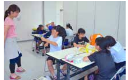
f 母活クラブ MANA

子どもと母の居場所づくりを目的とし、寺子屋やワークショップ、また中高生の制服の回収と譲渡を行います。