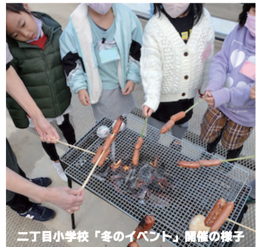
二丁目小学校「冬のイベント」開催の様子